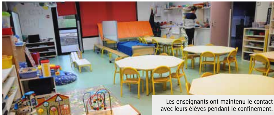
Les enseignants ont maintenu le contact avec leurs élèves pendant le confinement.