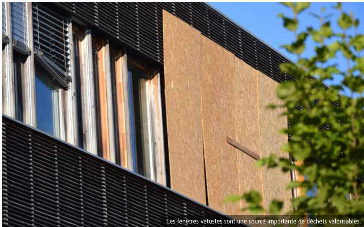
Les fenêtres vétustes sont une source importante de déchets valorisables.

Dans la Vienne, la majorité des fenêtres et portes vétustes finissent à l'incinération. La filière de recyclage n'est pas encore en place. Des initiatives existent néanmoins ici et dans les départements alentours.