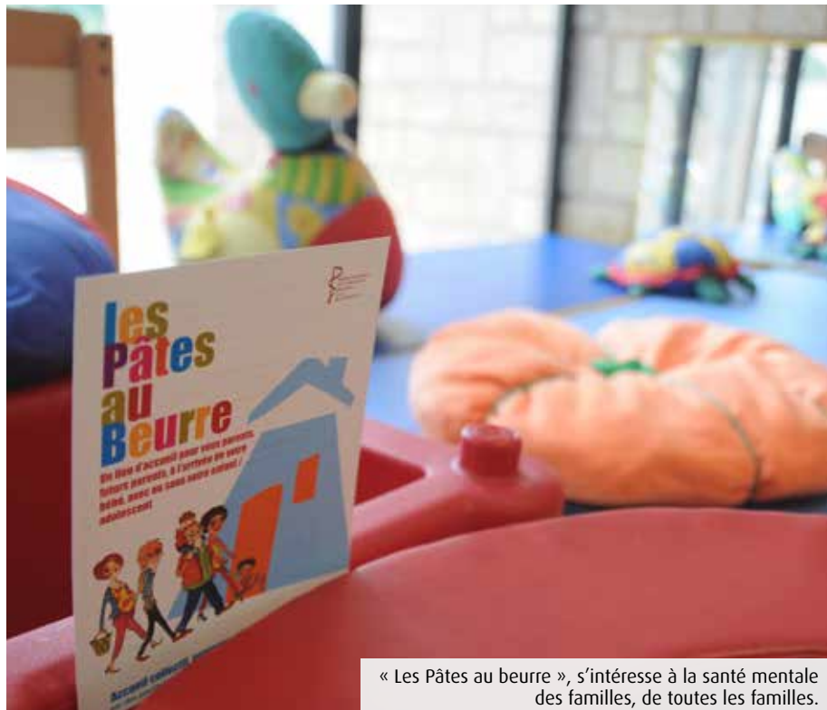
« Les Pâtes au beurre », s'intéresse à la santé mentale des familles, de toutes les familles.