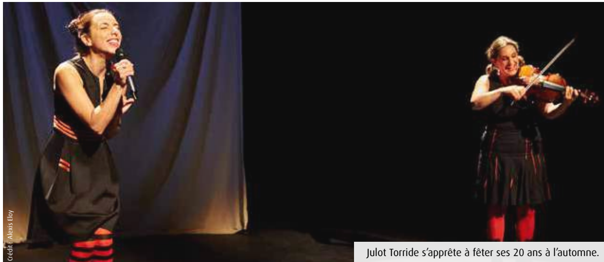
Julot Torride s'apprête à fêter ses 20 ans à l'automne.

20 ans, trois spectacles et toujours la même gouaille ! Julot Torride va fêter son anniversaire à l'automne. En attendant, le duo sera au Café-Cantine du Commerce de Gençay samedi.