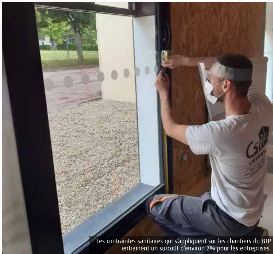
Les contraintes sanitaires qui s'appliquent sur les chantiers du BTP entraînent un surcoût d'environ 7% pour les entreprises.

« Le premier semestre avait été tout à fait honorable, avec une bonne visibilité sur les mois à venir. Depuis 2018, les investissements du Département et de la Région ont amorcé une dynamique pour notre secteur. C'est un signe d'attractivité qui incite les investisseurs à venir s'installer sur le territoire, comme Forsee Power par exemple. Ce que l'on attend aujourd'hui, c'est que le privé confirme dans les années à venir. »