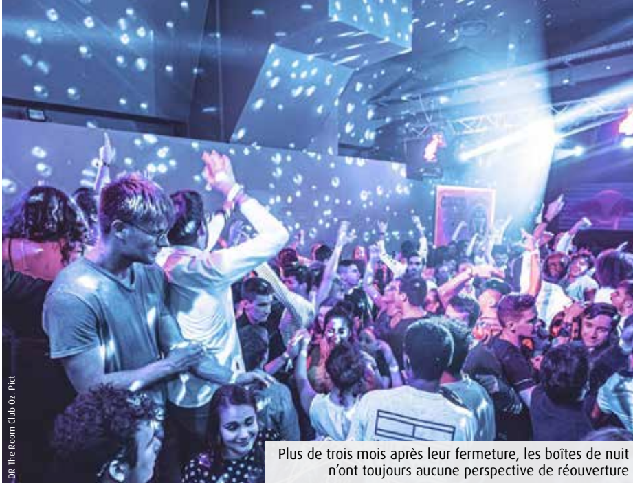
Plus de trois mois après leur fermeture, les boîtes de nuit n'ont toujours aucune perspective de réouverture

Ils sont les premiers à avoir fermé et seront probablement les derniers à rouvrir. A Poitiers, les gérants de boîtes de nuit souffrent de n'avoir que peu de perspectives sur l'avenir de leur activité et partagent un même sentiment d'être les « oubliés de l'après ».