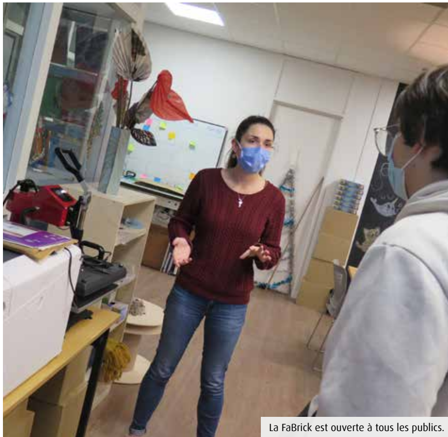
La FaBrick est ouverte à tous les publics.

Le campus de Poitiers abrite un Fab Lab imaginé par trois anciennes étudiantes en biologie. Contrairement à ce que pourrait laisser penser son implantation géographique, La FaBrick est ouverte à tout le monde.