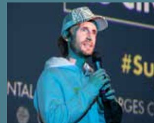
Philippe Lacheau, acteur et réalisateur.