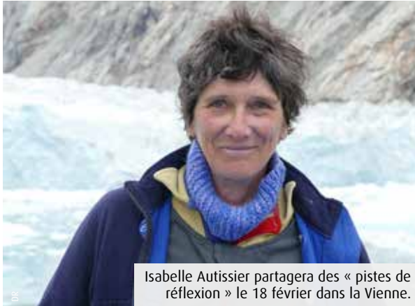
Isabelle Autissier partagera des « pistes de réflexion » le 18 février dans la Vienne.

La navigatrice et présidente d'honneur du WWF-France Isabelle Autissier participera à un débat public le 18 février, à Vouneuil-sous-Biard. L'occasion d'échanger quelques « pistes de réflexions » pour vivre ensemble en préservant la planète.