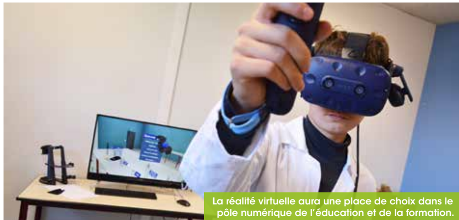
La réalité virtuelle aura une place de choix dans le pôle numérique de l'éducation et de la formation.